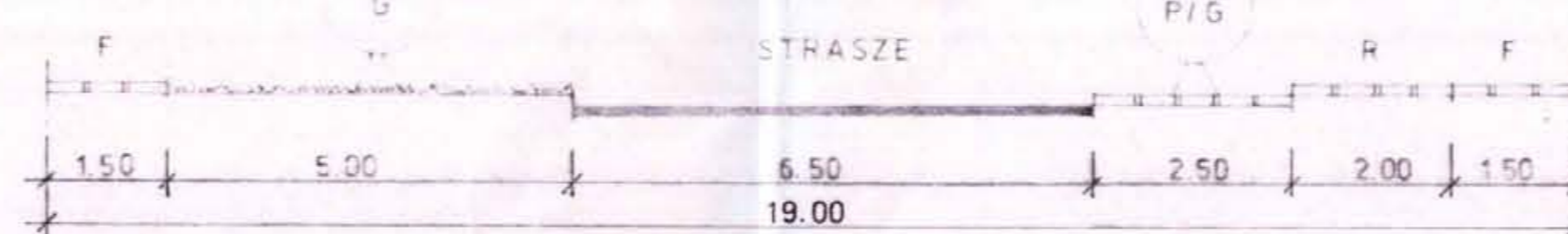
SCHNITT C-C M 1:100