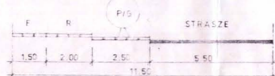
SCHNITT A-A BZW. B-B M 1:100