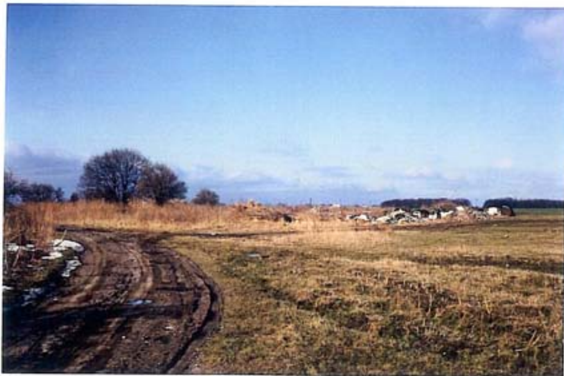
Ehemalige Ansiedlungen werden als 'wilde' Müllverkippungen benutzt Foto: Westlich von Fährrhof