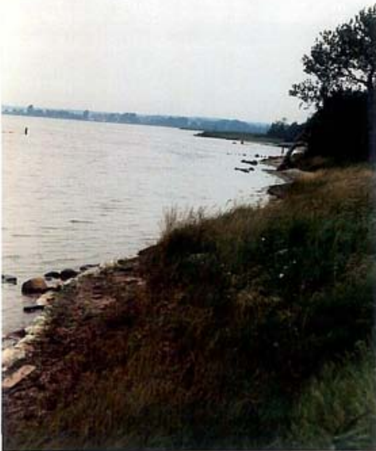
Die Idylle am Wieker Bodden täuscht; ungeklärte Abwässer und landwirtschaftliche Einträge führen zu Verunreinigungen des Gewässers Foto: Nördlich der Ortslage von Wiek