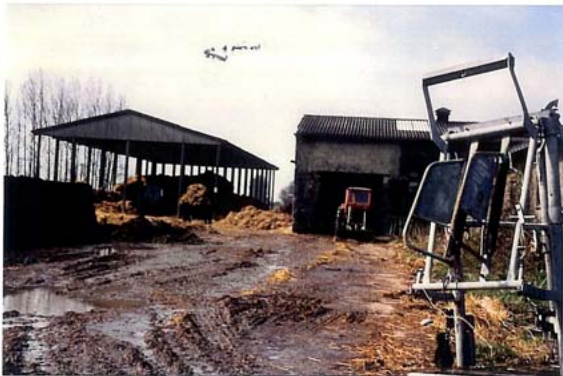
"Indusrtiell-landwirtschaftliche " Betriebe führen zu punktuellen Kontaminationen des Bodens Foto: Betriebsgelände der LPG in Parchow