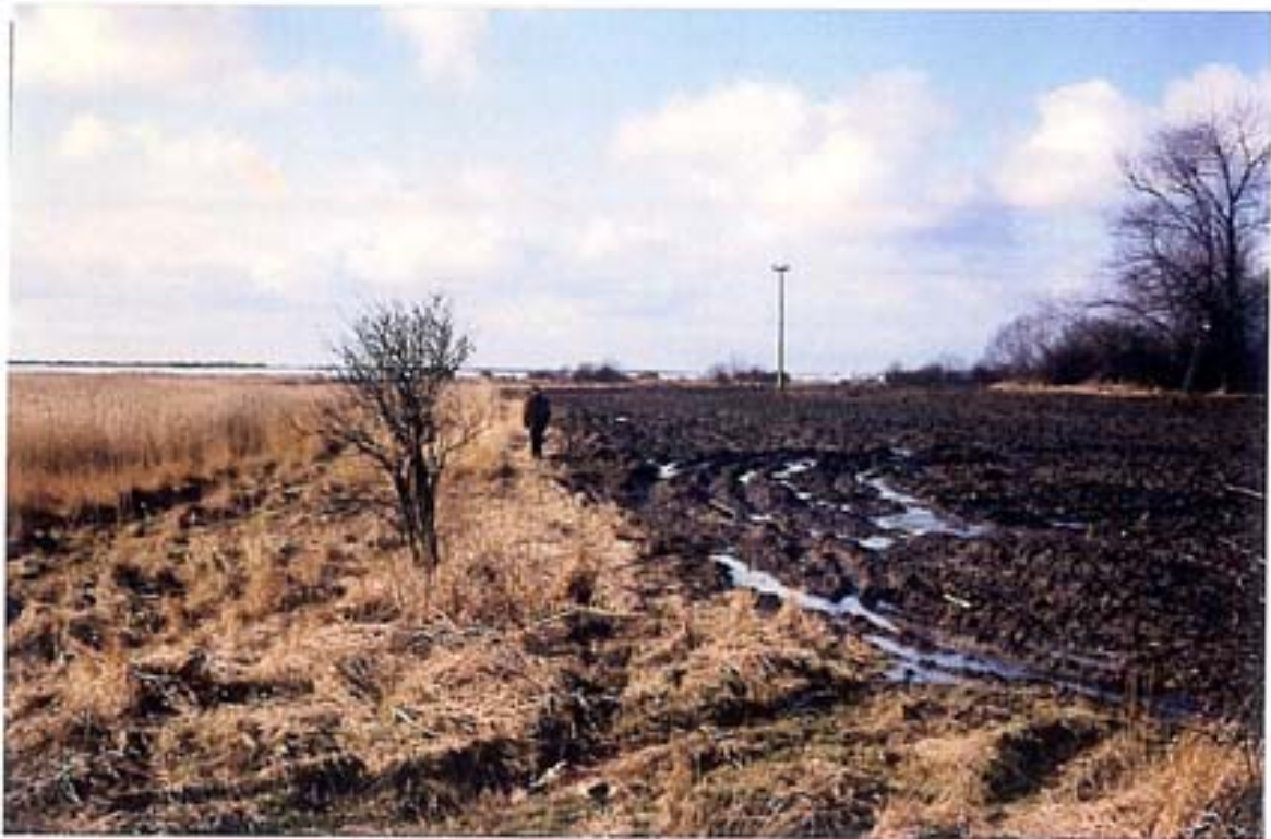
Die erschwerte Befahrbarkeit des Ackers (Staunässe) führt zu Bodenverdichtungen; angrenzende naturnahe Flächen werden durch die intensive Nutzung beeinträchtigt Foto: südlich von Fährhof