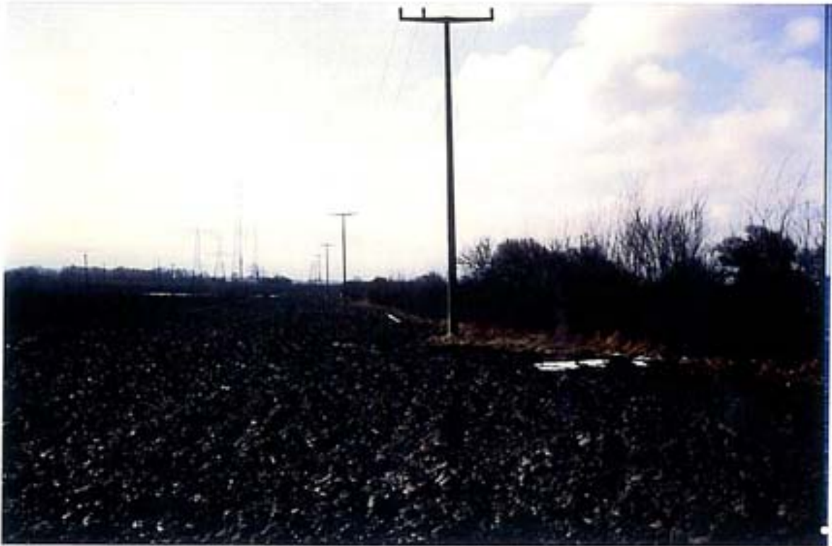
Elektrizitätsleitungen kreuzen und queren die landwirtschaftlichen Nutzflächen und erschweren die Bearbeitung Foto: Entlang des Wieker Boddens westlich Fährhof