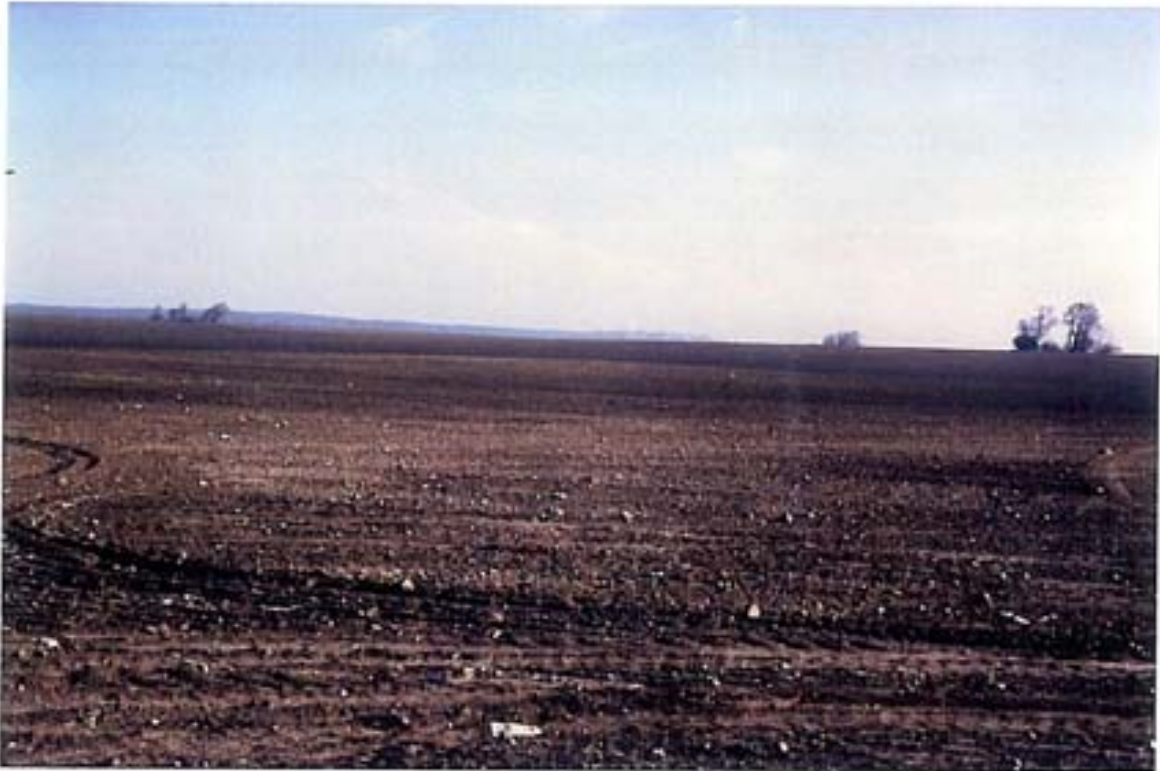
Großflächige Ackerschläge sind durch Wind und Wasser erosionsgefährdet Foto: Nördlich von Lüttkevitz