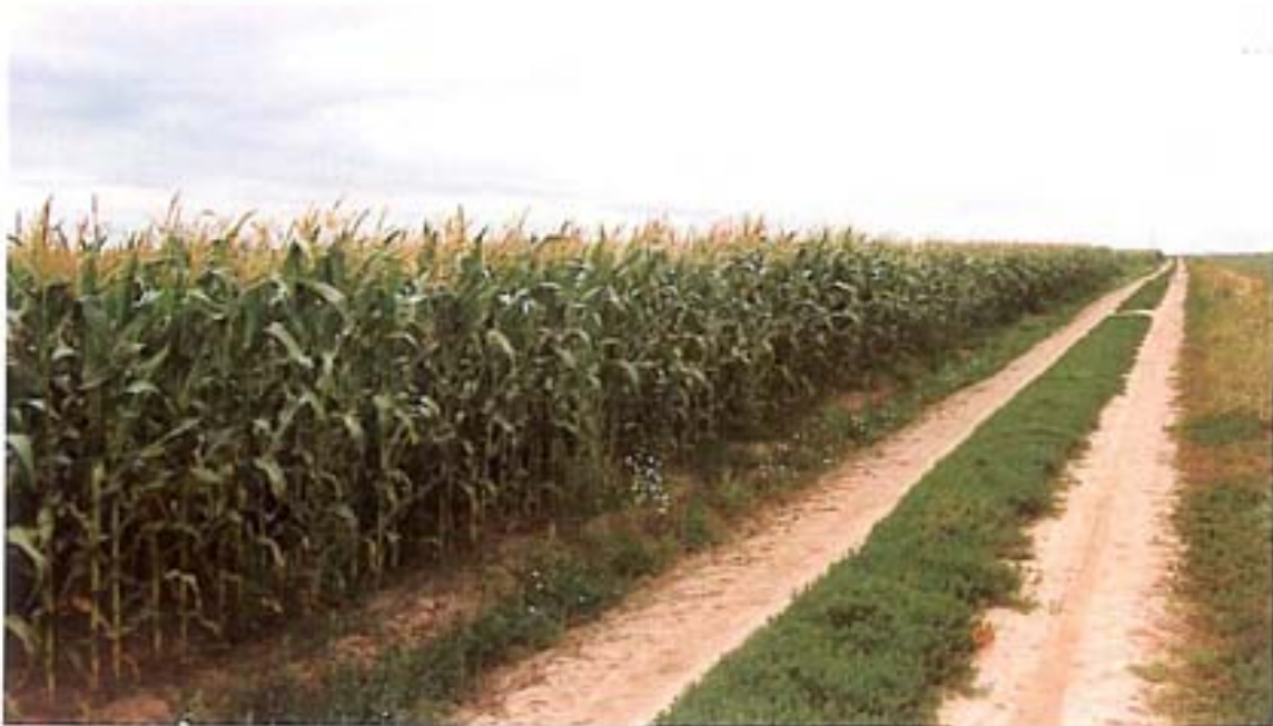
Im Projektgebiet erfordert der Maisanbau i. d. R. eine höhere chemische und mechanische Bearbeitungsintensität Foto: Westlich von Bohlendorf zwischen K 30 und Wieker Bodden