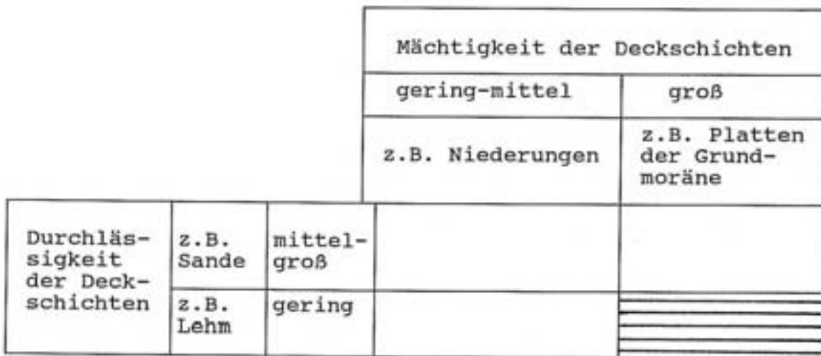
Abb. 16 Vereinfachte Einteilung der Schutzwirkung von Deckschichten

Die Verschmutzungsempfindlichkeit des Grundwassers gegenüber Schadstoffen ist besonders hoch, wenn die dem Grundwasserleiter überlagernden Deckschichten geringmächtig und zudem durchlässig sind. Die Abbildung 16 gibt eine vereinfachte Darstellung der Schutzwirkung bestimmter Deckschichten in Abhängigkeit von Bodenart und -mächtigkeit wieder.