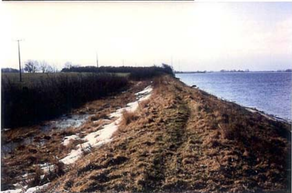
Der Boddendeich verhindert Überschwemmungen auf die Grünlandflächen der Parchower Rinne