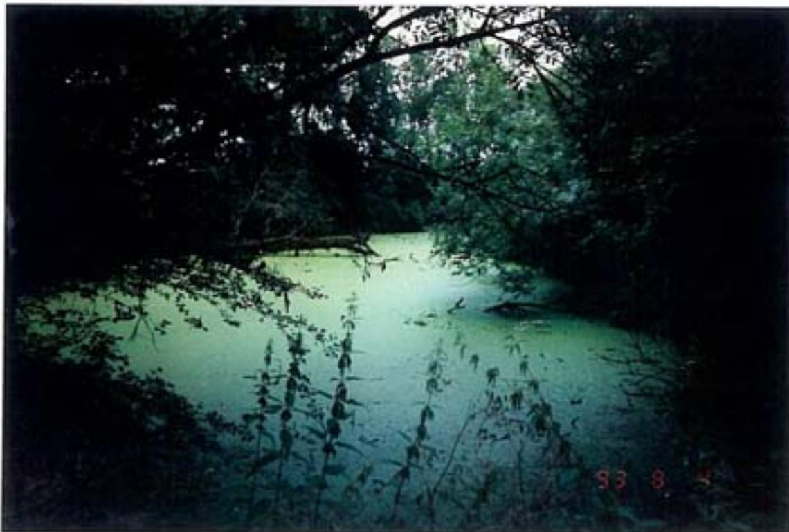
Eutrophierter Teich auf dem ehemaligen Gutshofgelände von Woldenitz