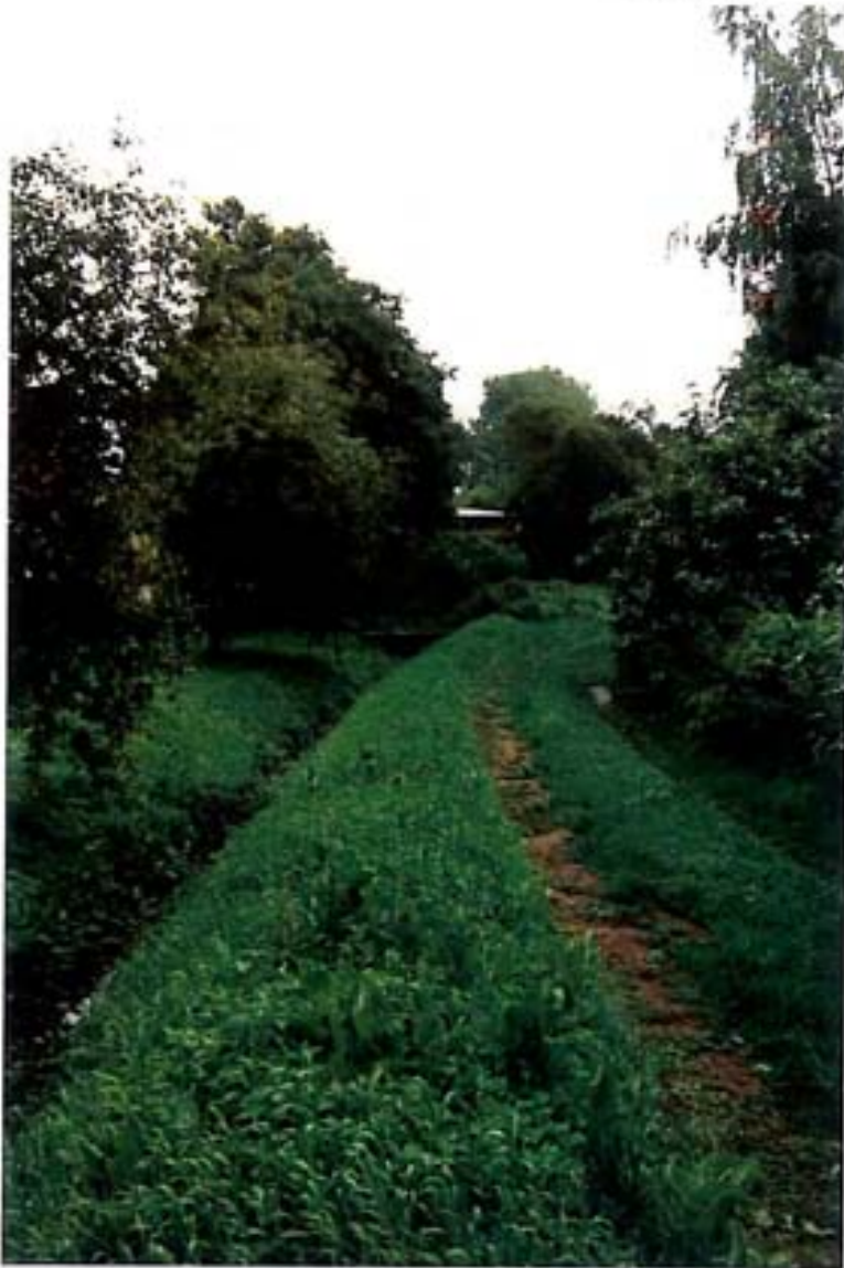
Der Graben (Zentraler Vorfluter) transportiert fäkalisches Abwasser in das Boddengewässer Foto: Südlicher Ortsrand von Wiek