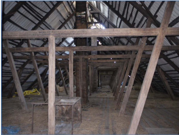
Abb. 7 Dachboden des ehem. Stallgebäudes.