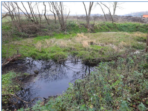
Abb. 4 Teich am Rand des Plangebietes (Dezember 2020).

Ein weiteres Kleingewässer (temporär wasserführend, starke Verlandung - Flutrasen) liegt außerhalb am Rand des Plangebietes. Hier konnten auf Grund von Wassermangel im Frühjahr keine Amphibien festgestellt werden.