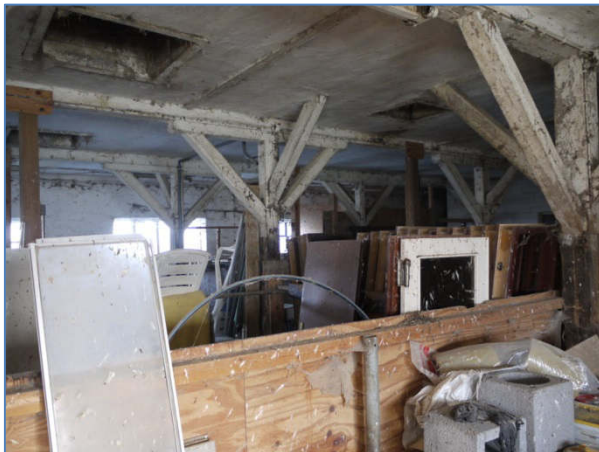
Abb. 5 Mit Kot von Rauchschwalben befleckte Gegenstände im ehem. Stallgebäude.

Zudem wurden der Rotschwanz und die Bachstelze beobachtet, die ihre Nistplätze jedoch nicht am betreffenden Gebäude haben, sondern regelmäßig andere Gebäude angefliegen haben.