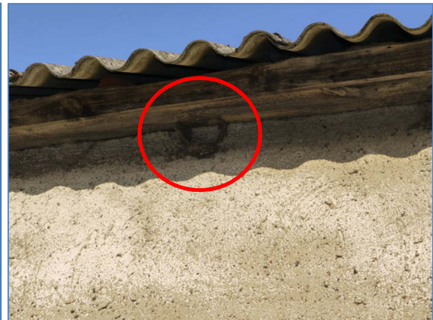
Abb. 6 Altes Mehlschwalbennest.