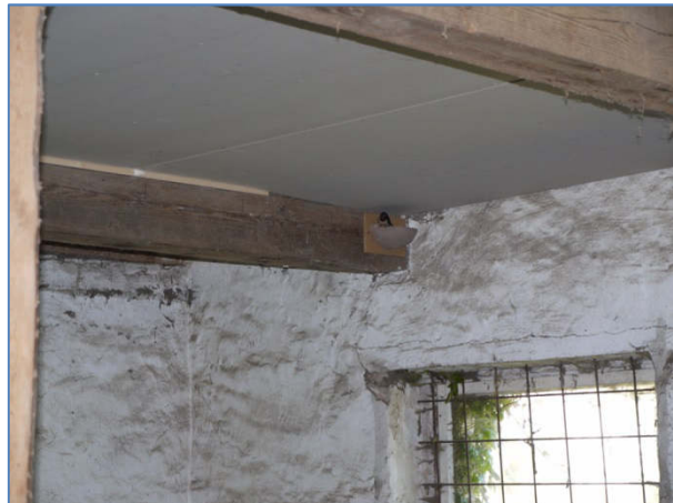
Abb. 10 Beispiel für die 10 Ersatznistplätze für Rauchschwalben im bestehenden Pferdestall, welche bereits im Mai 2019 teilweise genutzt wurden.

Bei der Begehung zur Potentialabschätzung in 2020 wurden keine Höhlungen in Gehölzen gefunden, so dass hier Höhlenbrüter ausgeschlossen werden können. Die Vegetationsstrukturen in der Ortslage lassen ein typisches Artenspektrum ländlicher Ortschaften erwarten. Während der Begehung konnten folgende Arten durch Sichtbeobachtung oder Verhören in der Ortslage festgestellt werden: