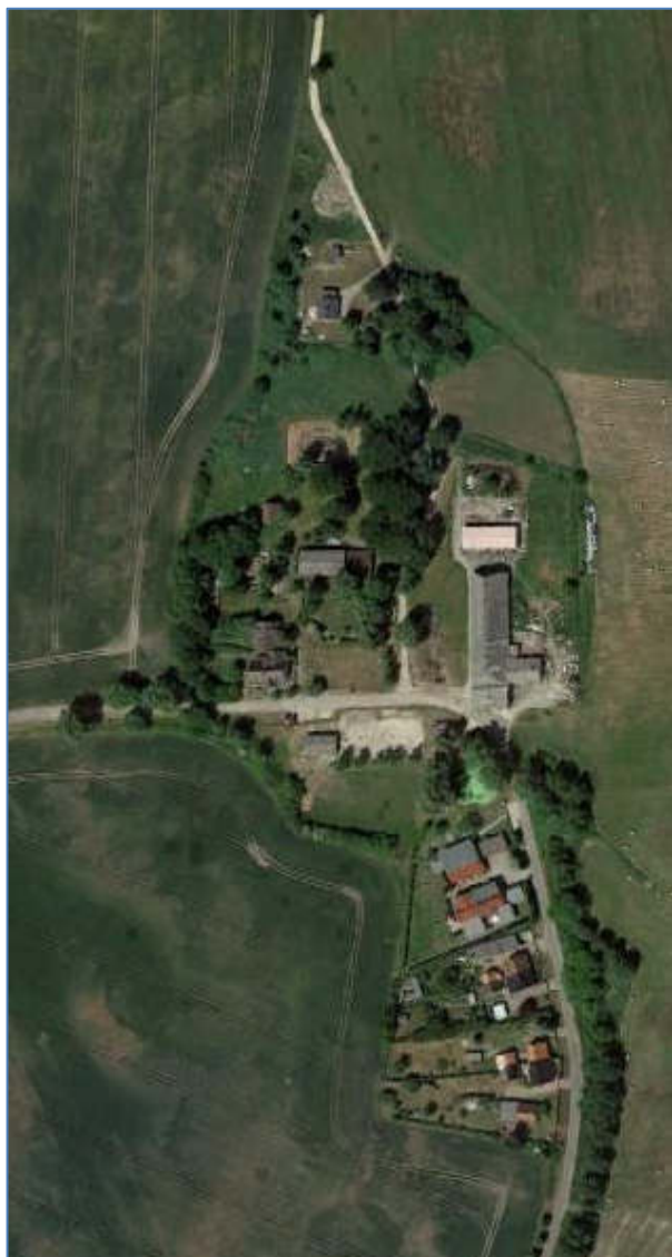
Abb. 3 Luftbild Grabitz, Gemeinde Rambin