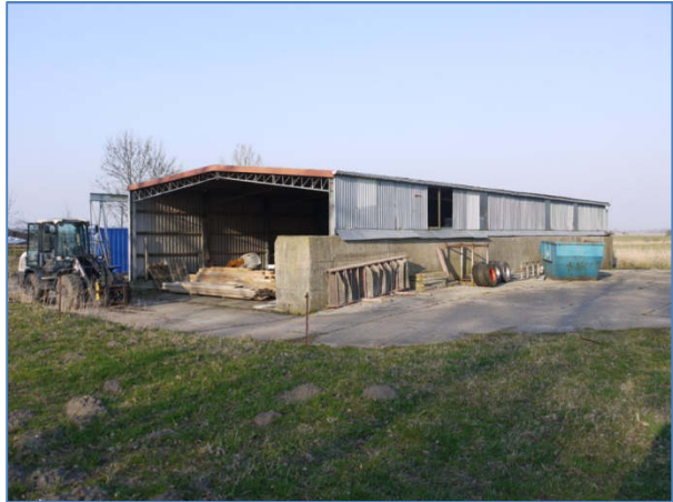
Abb. 8 Wellblechhalle, die abgebaut und dann an anderer Stelle neu errichtet werden sollte.