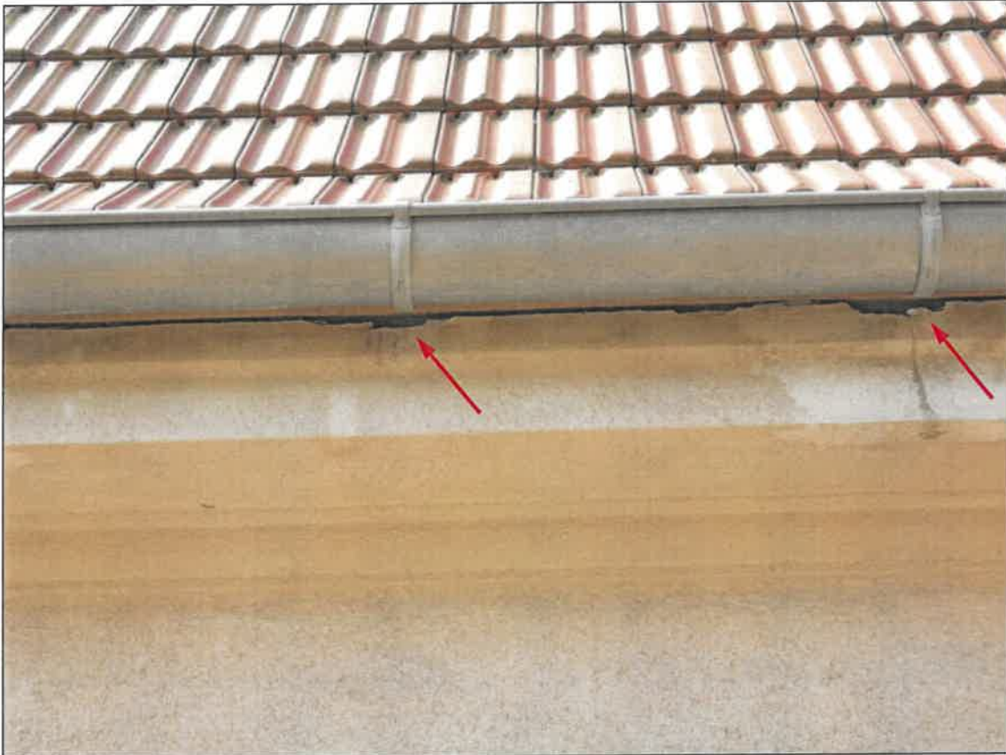
Abb. 4g Nordost-Fassade mit Haussperlings-Brutplätzen in den Mauerwerks-Löchern unterhalb der Dachtraufe