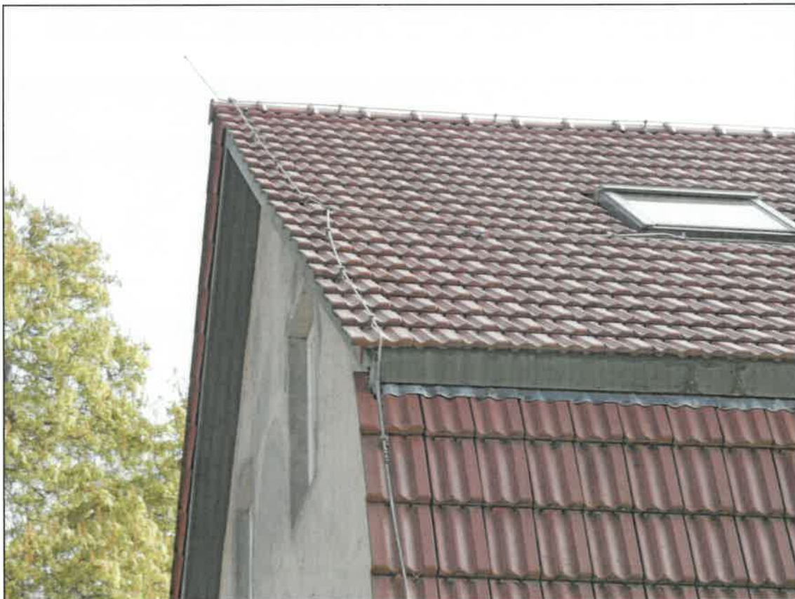
Abb. 5a Nordwest-Ecke mit aktuell genutztem Haussperlings-Brutplatz – vgl. Abb. 5b&c)