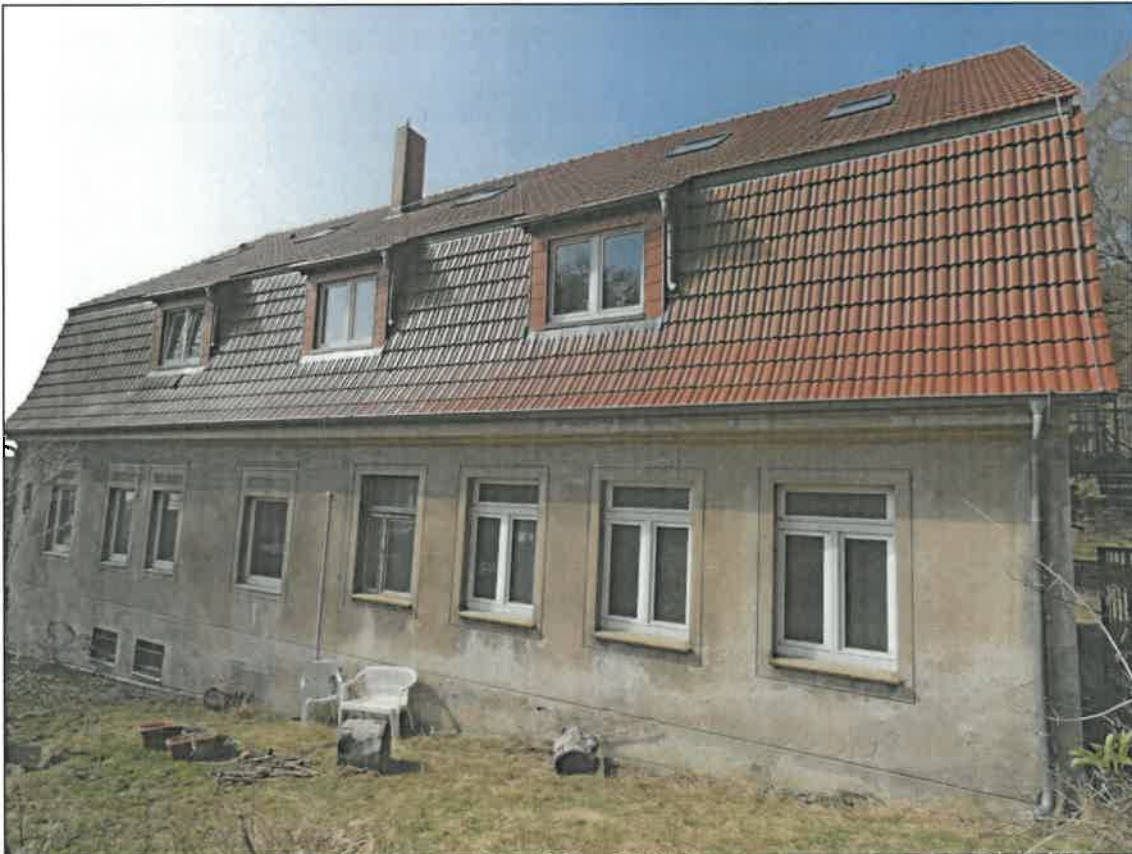
Abb. 4f Nordost-Fassade mit Haussperlings-Brutplätzen in den Mauerwerks-Löchern unterhalb der Dachtraufe