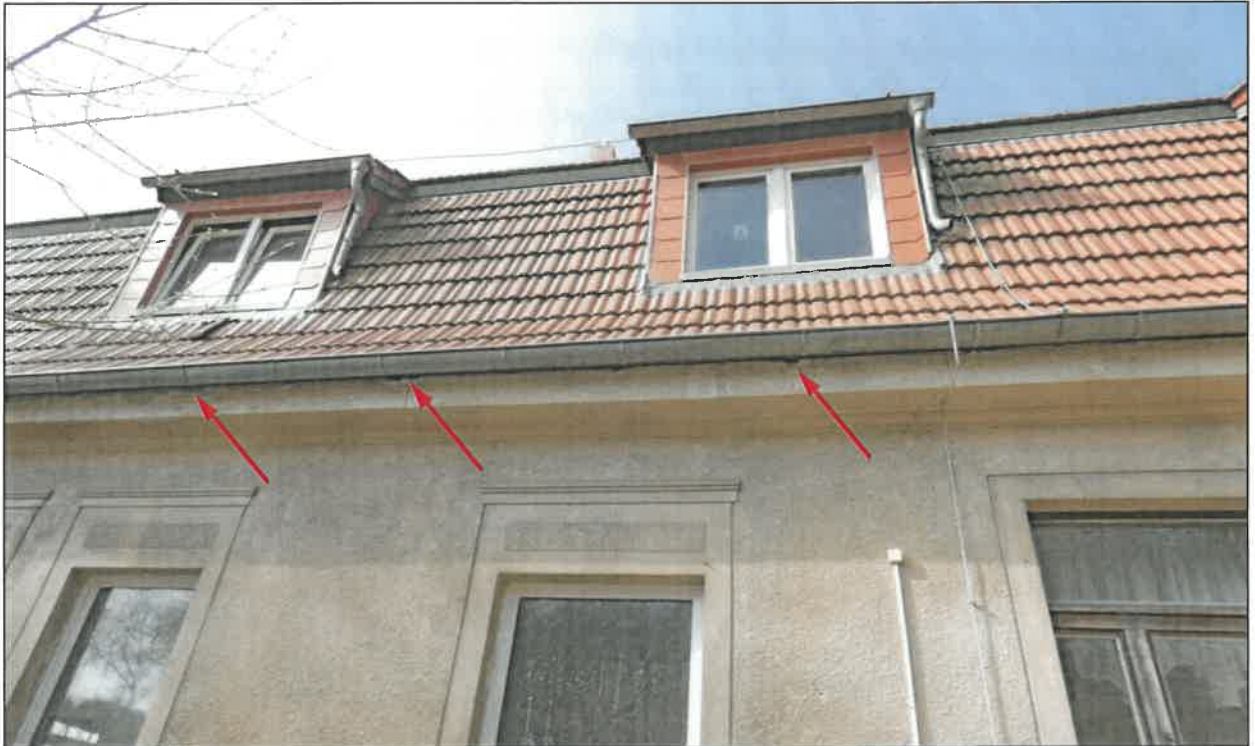
Abb. 4i Nordost-Fassade mit Haussperlings-Brutplätzen in den Mauerwerks-Löchern unterhalb der Dachtraufe