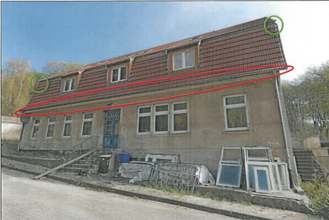
Abb. 4a Südwest-Fassade mit (alten) Haussperlings-Brutplätzen in den Mauerwerks-Löchern unterhalb der Dachtraufe (rot, Detail vgl. beispielhaft Abb. 4b) sowie aktuell genutzten Brutbereichen in den Ecken des Mansardgiebels (grün, Detail vgl. beispielhaft Abb. 4c-)