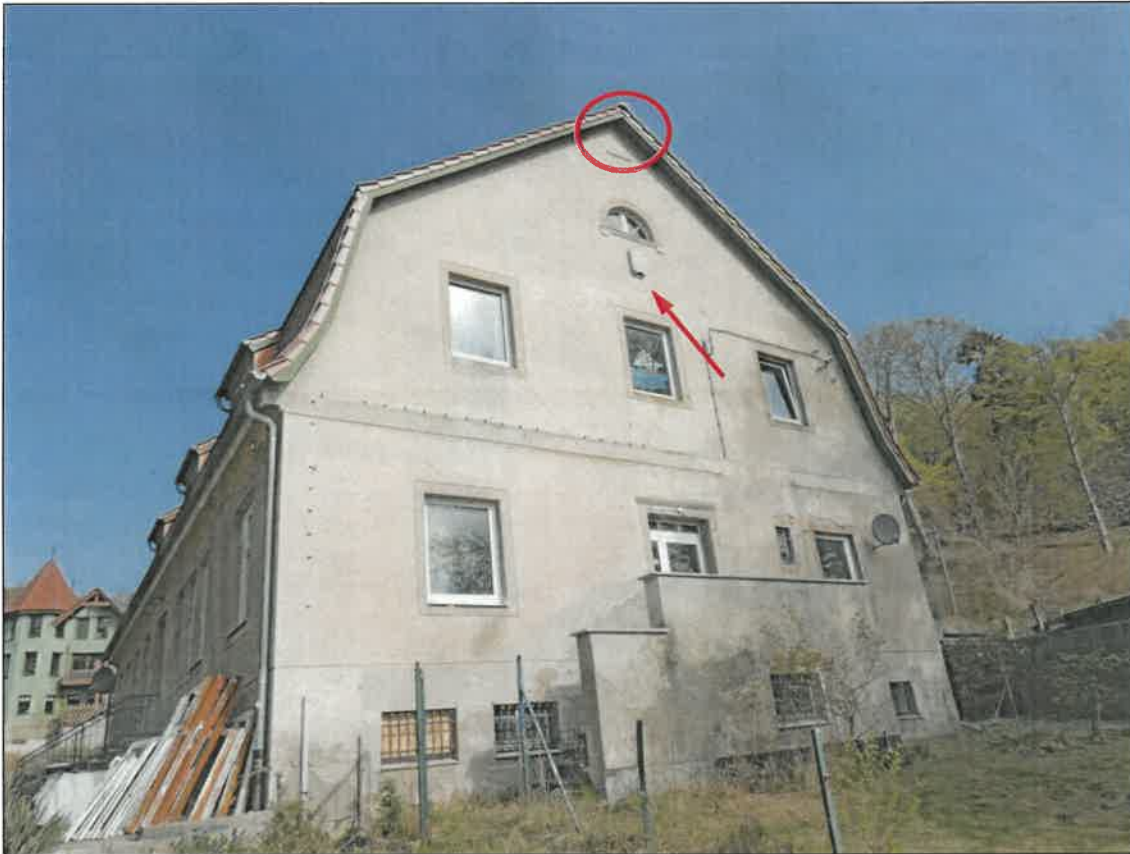
Abb. 2a Südost-Giebel mit Fledermaus-Fassadenkasten (Pfeil) und altem Schwalbennest (Kreis) – Details vgl. Abb. 2b & 3a-b