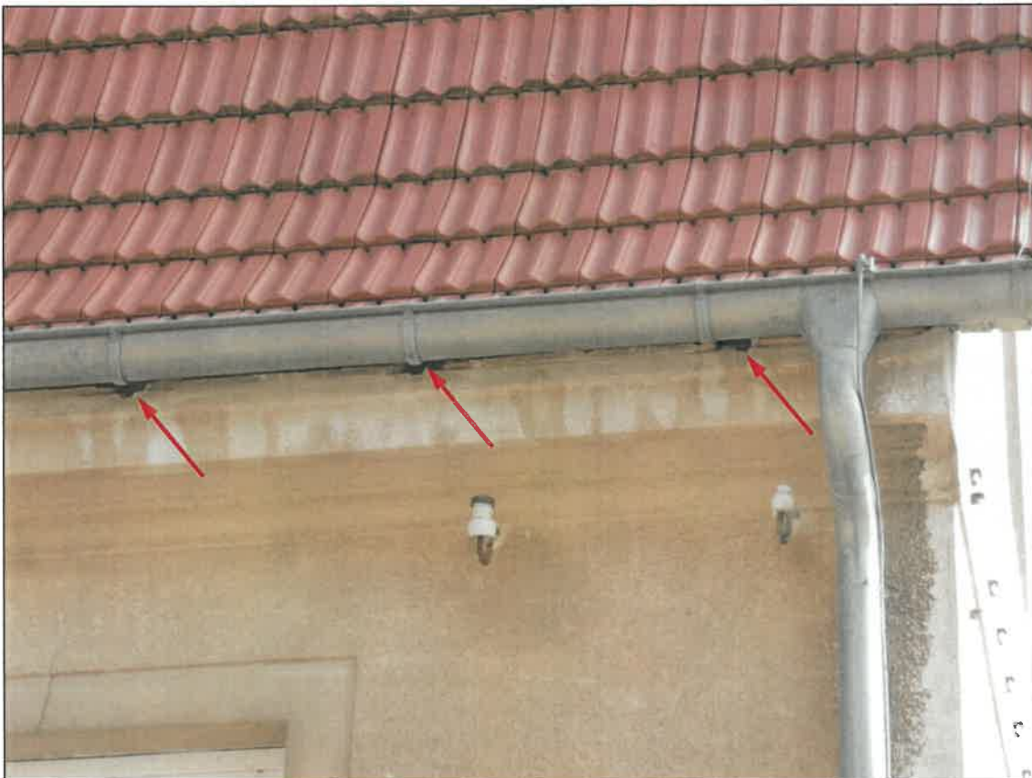
Abb. 4b Südwest-Fassade mit Haussperlings-Brutplätzen in den Mauerwerks-Löchern unterhalb der Dachtraufe – hier beispielhaft Löcher an der Südwest-Ecke