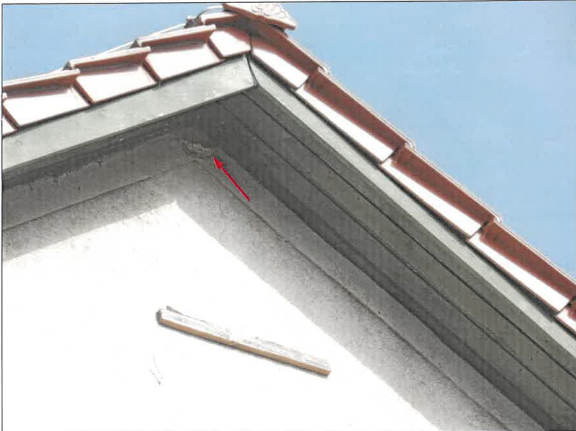
Abb. 3a Südost-Giebel mit altem Schwalbennest – Detail vgl. Abb. 3b