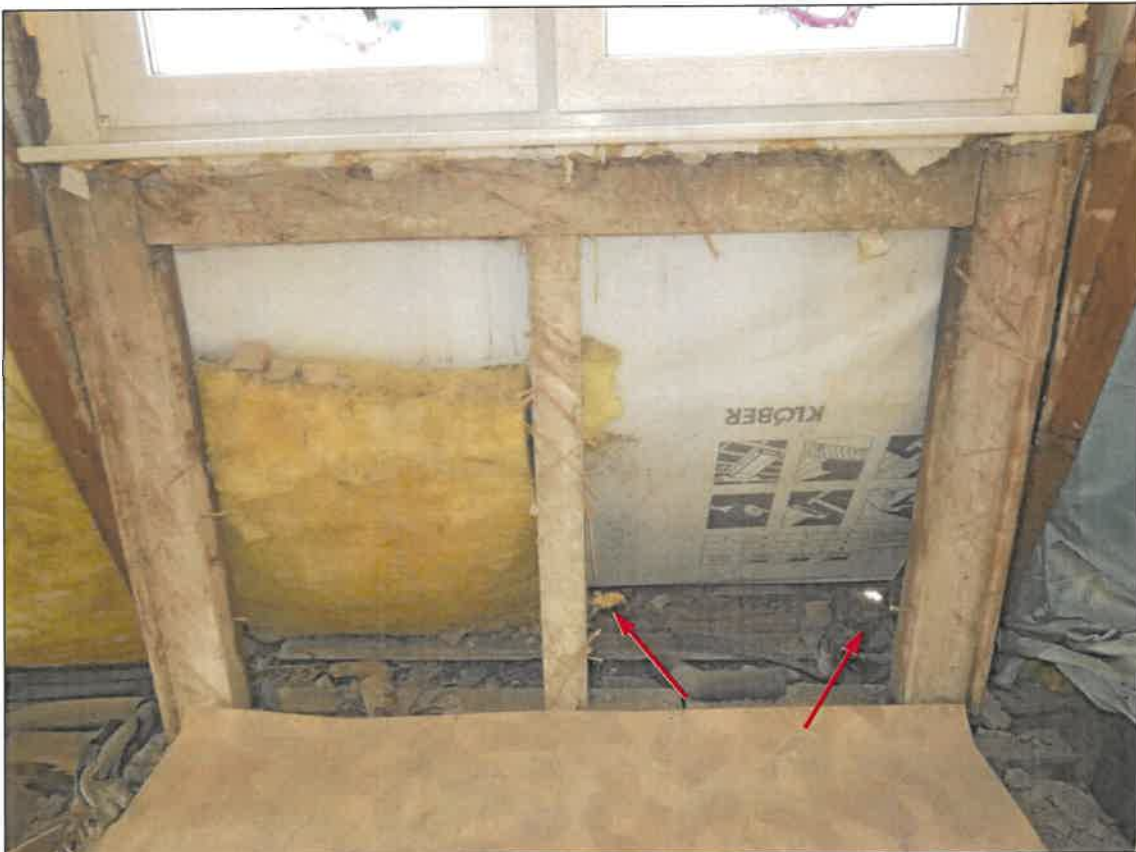
Abb. 4d Südwest-Fassade innenseitig mit altem Nistmaterial Haussperlings-Brutplätzen hinter den Mauerwerks-Löchern – Detail vgl. Abb. 4e