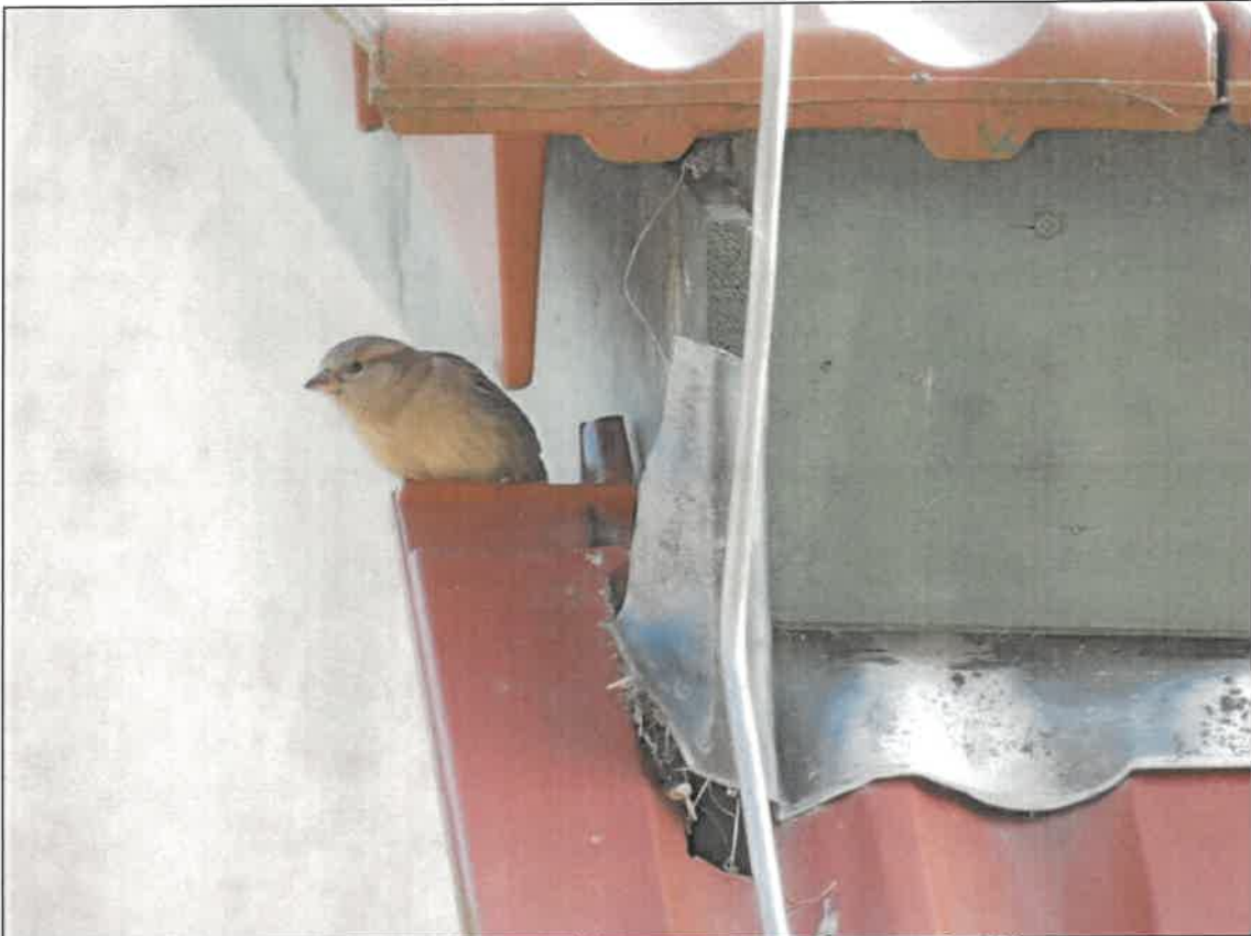
Abb. 5b Haussperlings-Weibchen am Brutplatz an Nordwest-Ecke des Mansardgiebeldaches