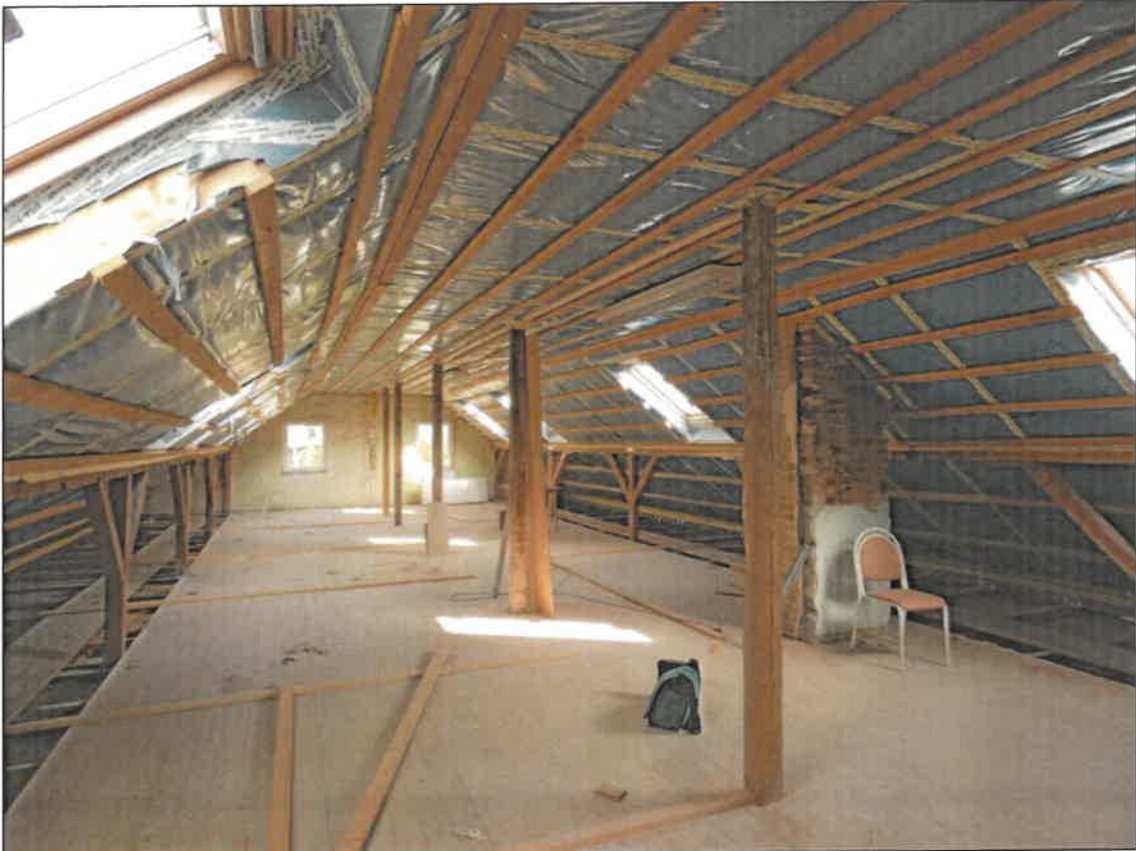
Abb. 1b Dachraum