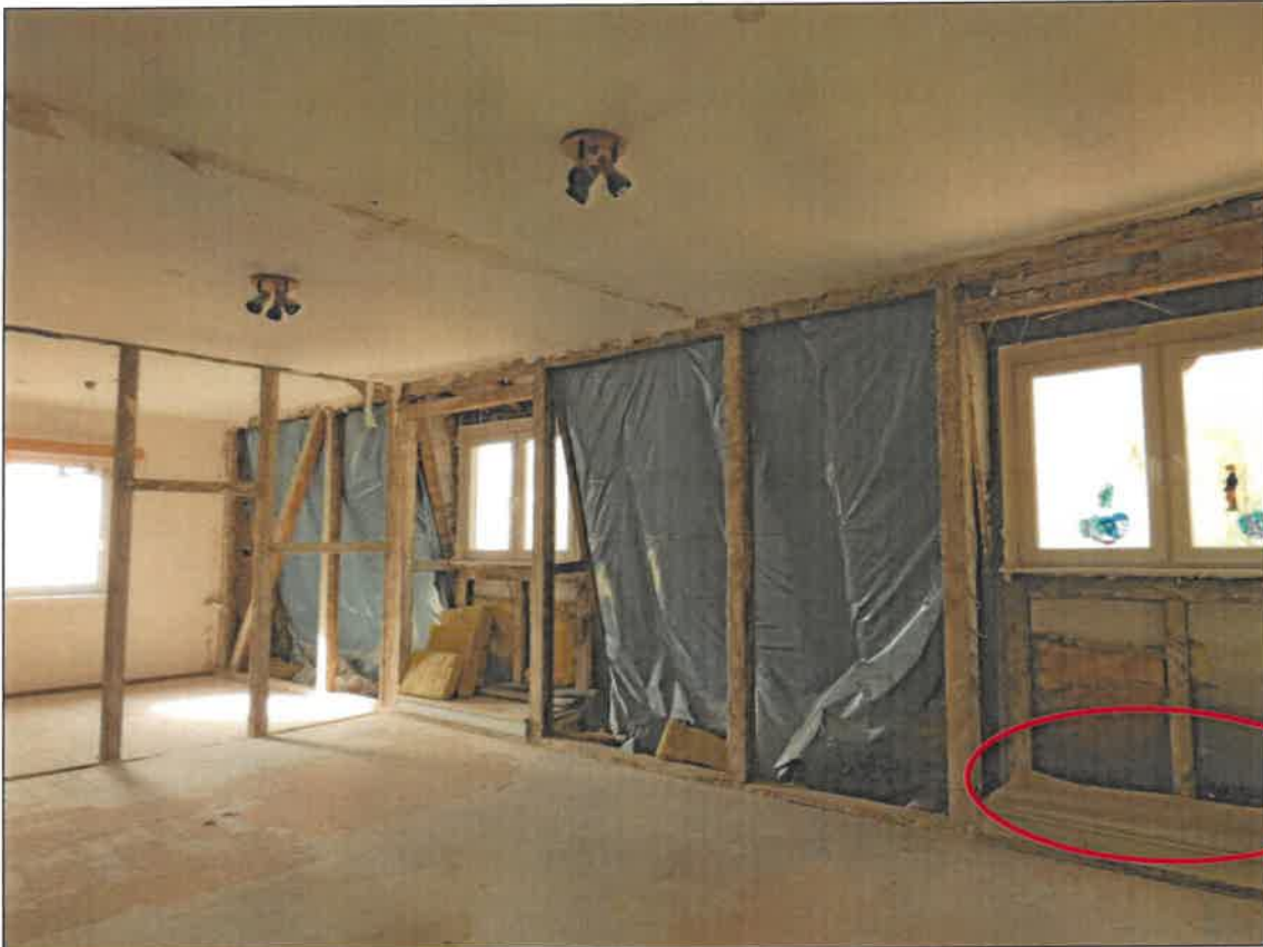
Abb. 4c Südwest-Fassade mit Haussperlings-Brutplätzen in den Mauerwerks-Löchern unterhalb der Dachtraufe – hier innenseitig beispielhaft mit Nistmaterial „hinter“ den Löchern