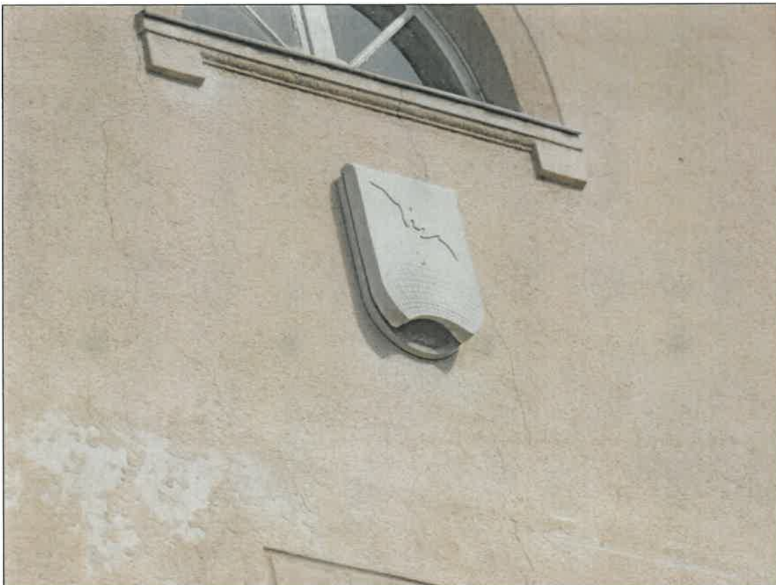
Abb. 2b Fledermaus-Fassadenkasten (Typ 1FQ Fa. Schwegler) am Südost-Giebel, unbesetzt