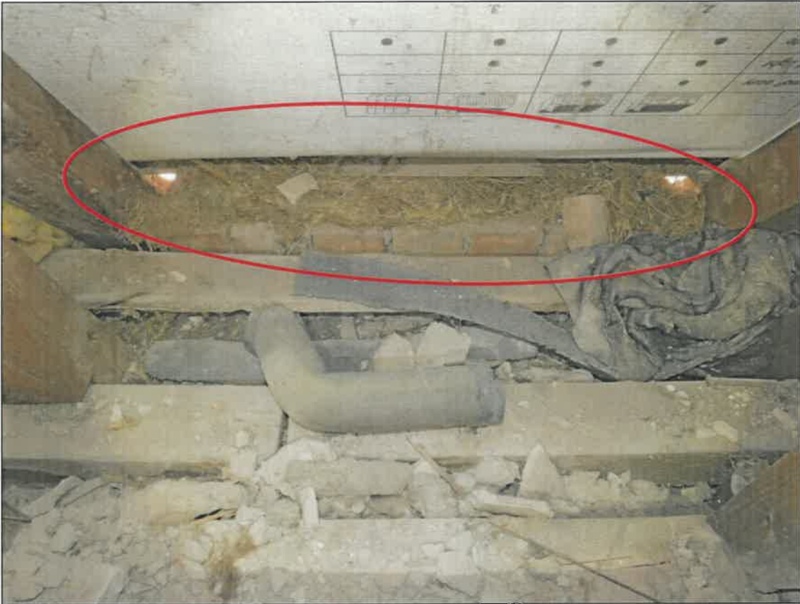
Abb. 4e Altes Nistmaterial Haussperlings-Brutplätzen hinter den Mauerwerks-Löchern – Detail zu Abb. 4d