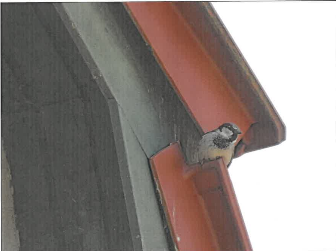
Abb. 5c Haussperlings-Weibchen am Brutplatz an Nordwest-Ecke des Mansardgiebeldaches