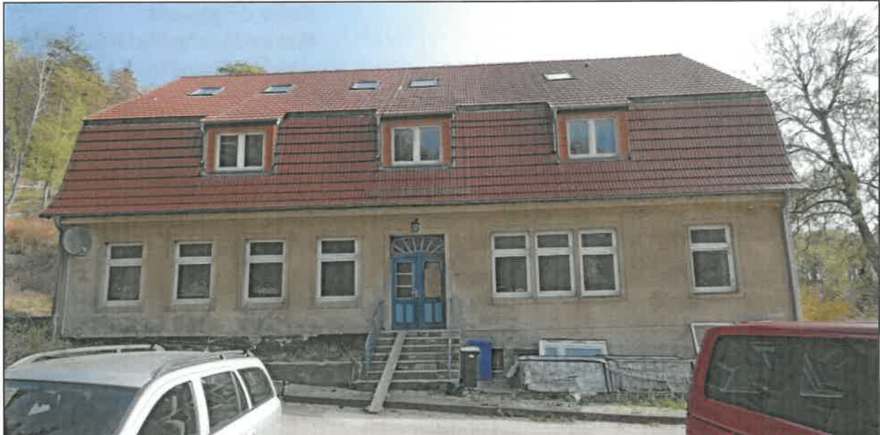
Abb. 1a Ansicht von Südwest