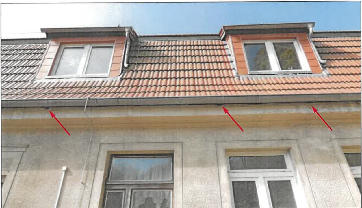
Abb. 4h Nordost-Fassade mit Haussperlings-Brutplätzen in den Mauerwerks-Löchern unterhalb der Dachtraufe