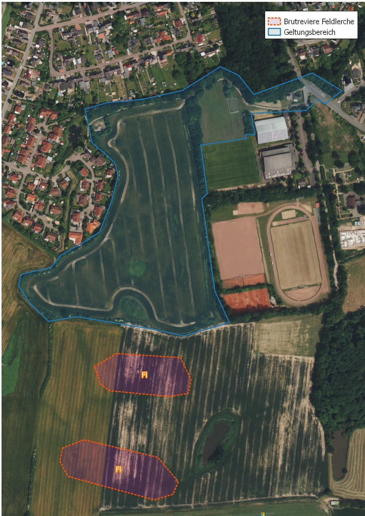
Abbildung 1: Lage des Geltungsbereiches des BPlan 67 der Gemeinde Ahrensböök sowie ermittelte Brutreviere der Feldlerche.