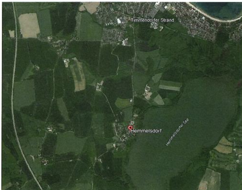
Bild 1: Auszug Google vom 02.03.2022

Die Ortslage Hemmelsdorf liegt am Hemmelsdorfer See bzw. nur ca. 3 km von der Ostsee entfernt. Zudem besteht eine kurze Anbindung zur ca. 2 km entfernt gelegenen Autobahn A1.