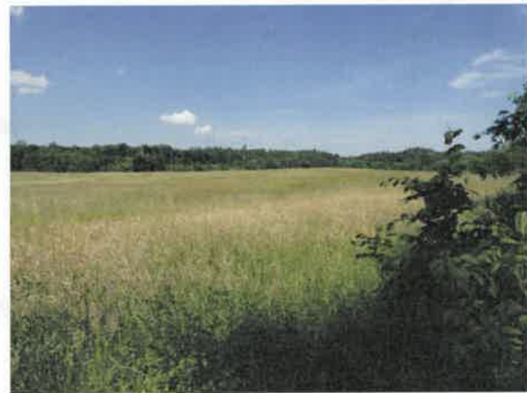
Abb. 2.2: Übersicht über das Plangebiet – östlicher Teil.

Im nordöstlichen Bereich des Plangebietes befinden sich zwei Kleingewässer, wovon das westliche durch Gehölze beschattet ist und größtenteils eine steile Uferböschung ausweist. Schwimmblattpflanzen wie Kleine Wasserlinse und Wasser-Knöterich sind in geringer Stetigkeit und geringer Deckung vorhanden. Im Randbereich stehen Röhrichte aus Salz-Teichsimse und Sumpfbirse (siehe Abb. 2.3). Das zweite weiter östlich gelegene Kleingewässer mit Armleuchteralgen am Grund (siehe Abb. 2.4) stellt ebenso wie das westliche Gewässer, ein geschütztes Biotop nach § 30 BNatSchG dar.