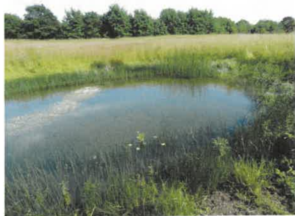
Abb. 2.4: Östliches Kleingewässer.

Östlich in ca. 200 m Entfernung liegt das FFH-Gebiet 1930-391 „Süsel Baum und Süseler Moor“. Westlich der Vorhabenfläche (in ca. 1,5 km Entfernung) befinden sich das Naturschutzgebiet „Middelburger Seen“ sowie das Landschaftsschutzgebiet „Pönitzer Seenplatte und Haffwiesen“.