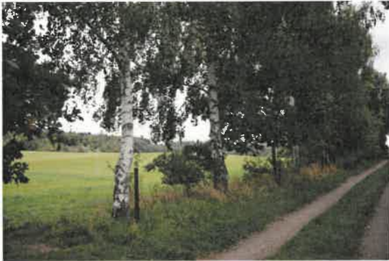
Abb. 2.5: Gehölze im Bereich der Zufahrt.

Der am westlichen Rand befindliche Steilhang und die beiden Kleingewässer bleiben von der Planung unberührt und erhalten.