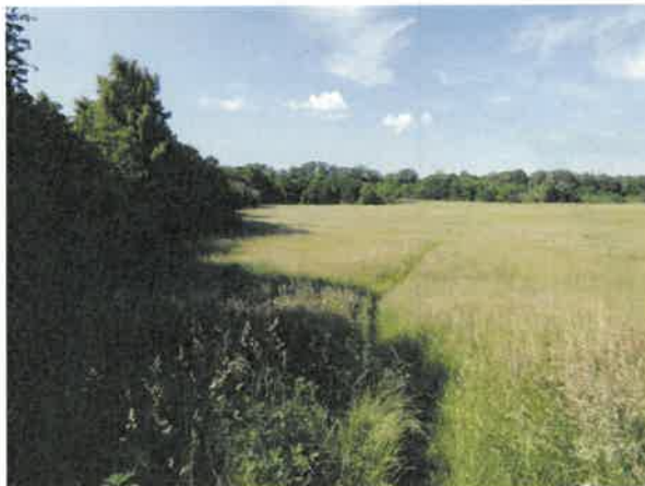
Abb. 2.1: Übersicht über das Plangebiet – westlicher Teil.

Das Plangebiet befindet sich in einer leicht welligen Senke, die durch Kiesabbau entstanden ist. Nachdem der Kiesabbau eingestellt wurde, hat sich auf dem Gelände Grünland entwickelt, welches mäßig artenreich ausgeprägt ist (siehe Abb. 2.1, Abb. 2.2). Umsäumt wird das Plangebiet im östlichen und südlichen Bereich von Feldhecken (nach § 21 LNatSchG geschützt), wobei der südöstliche Teil frei bleibt. Am westlichen und nordwestlichen Randbereich befindet sich ein 2 - 5 Meter hoher Steilhang mit Feldgehölz (geschütztes Biotop nach § 30 BNatSchG und § 21 LNatSchG). Bei den Gehölzen dominieren Hänge-Birke und Stiel-Eiche sowie stellenweise Zitterpappel. Daneben sind typische Heckensträucher wie Eingriffeliger Weißdorn und Hasel verbreitet. In einer feuchten Senke erstreckt sich am Hangfuß ein Großseggenried mit einem Dominanzbestand der Sumpf-Segge. Im nördlichen Bereich wird das Plangebiet von Straßenbegleitgrün mit jungen Bäumen begrenzt.