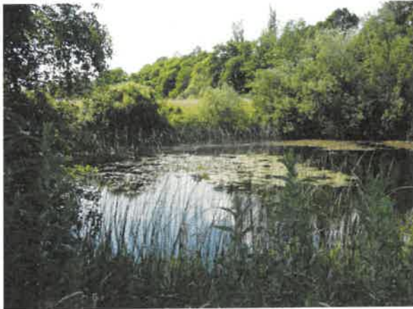
Abb. 2.3: Westliches Kleingewässer.

Eine Vorbelastung besteht hinsichtlich Lärm durch die nördlich gelegene L 309, die als Zubringer zur B 76 dient sowie durch die nördlich gelegenen Gewerbebetriebe (Asphaltwerk und Recyclingzentrum).