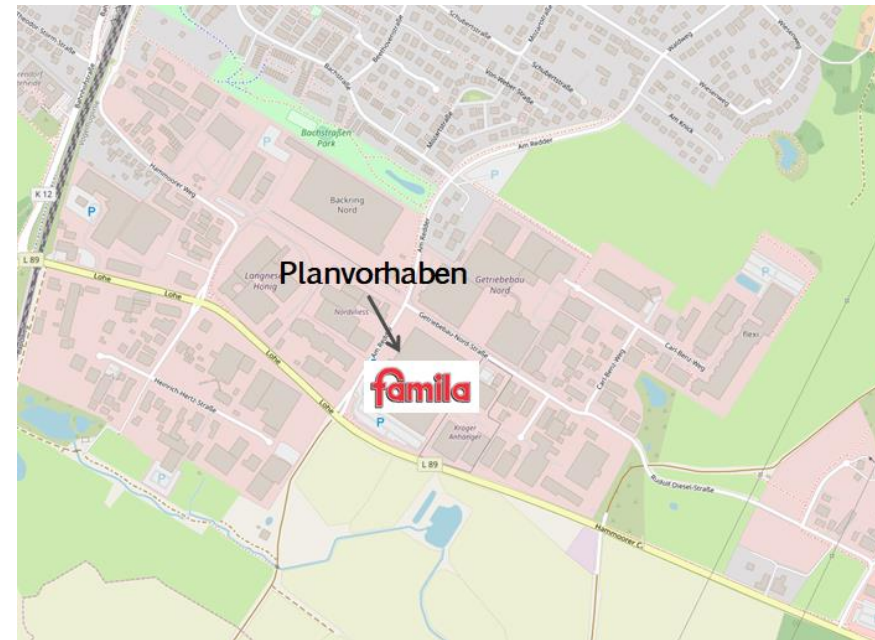
Abb. 2: Lage des Planvorhabens in Bargteheide (Mikrostandort)

Kartengrundlage: openstreetmap; Bearbeitung durch die cima 2019