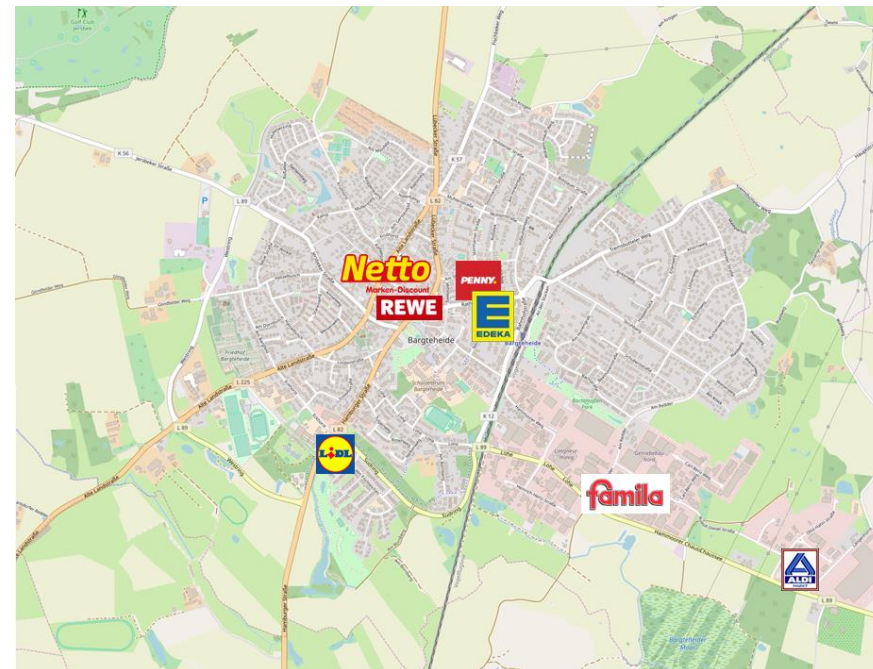
Abb. 5: Lage der Wettbewerber in Bargteheide (Auswahl)

Kartengrundlage: openstreetmap; Bearbeitung durch die cima 2019