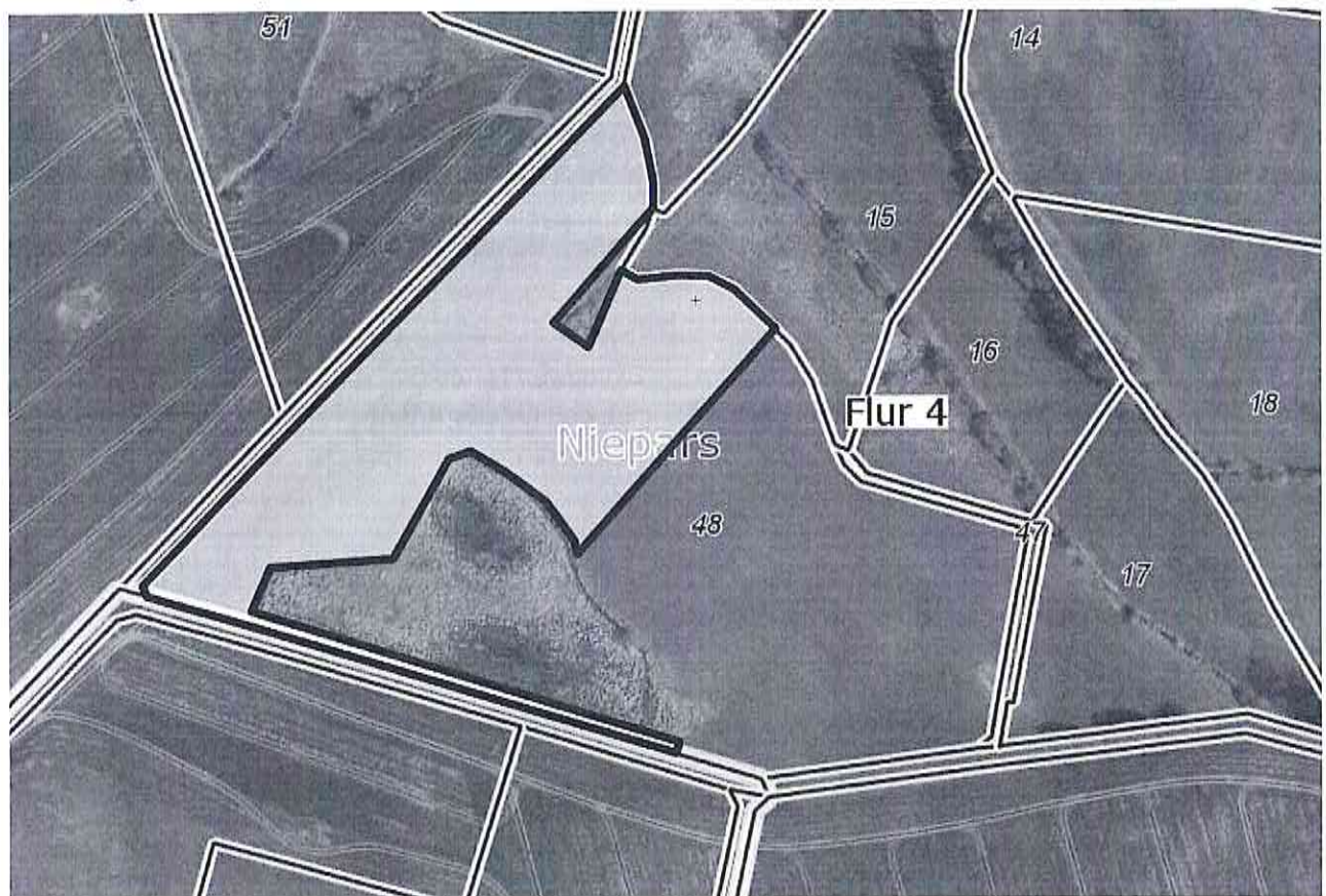
Karte: Lage der Ausgleichsfläche

entstehenden zusätzlichen Versiegelungen erfolgen. Entsprechend dem Gesamtkompensationsbedarf von 20.919 Eingriffsäquivalenten für die Eingriffe in gesetzlich geschützte Biotope und 516 Eingriffsäquivalenten für den zusätzlichen Ausgleich wird eine Fläche mit der Größe von 21.435 m 2 im Westen des Flurstücks dauerhaft der Sukzession überlassen und durch dauerhafte Kennzeichnung der Flächengrenzen mit Holzpfählen/Feldsteinen im Abstand von max. 10 m gekennzeichnet. Die Abgrenzung erfolgt im Nordwesten und Südwesten entlang der Flurstücksgrenzen und folgt im Weiteren den hier bereits vorhandenen Biotopen. Entlang der Westgrenze werden hier außerdem die erforderliche Pflanzung von 30 Bäumen (12 Bäume als Ausgleich für die erforderlichen Fällungen gesetzlich geschützter Bäume und 18 Bäume als Ausgleich für den Wegfall der straßenbegleitenden Baumpflanzungen) vorgenommen werden. Zur dinglichen Sicherung der Fläche für den Naturschutz wird eine beschränkte persönliche Dienstbarkeit in das Grundbuch eingetragen.