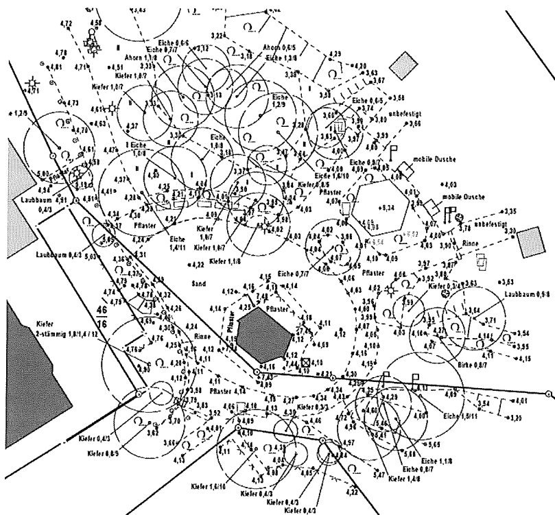
Abb.: Auszug Aufmaß

Südwestlich grenzt die Bebauung der Strandallee bzw. Kurpromenade an das Plangebiet an; im Osten befinden sich Dünenabschnitte und daran anschließend der Ostseestrand. Im Bereich des WC-Gebäudes sind zwei Strandzugänge vorhanden.