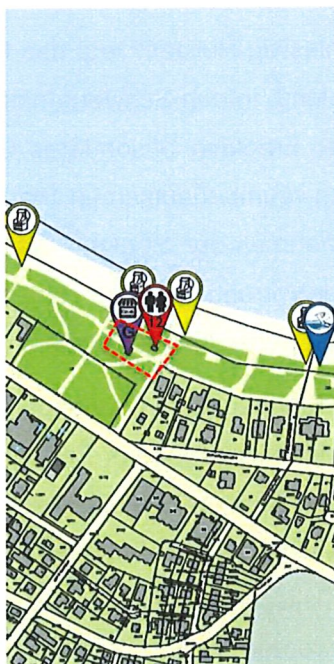
C – Kiosk Grimm