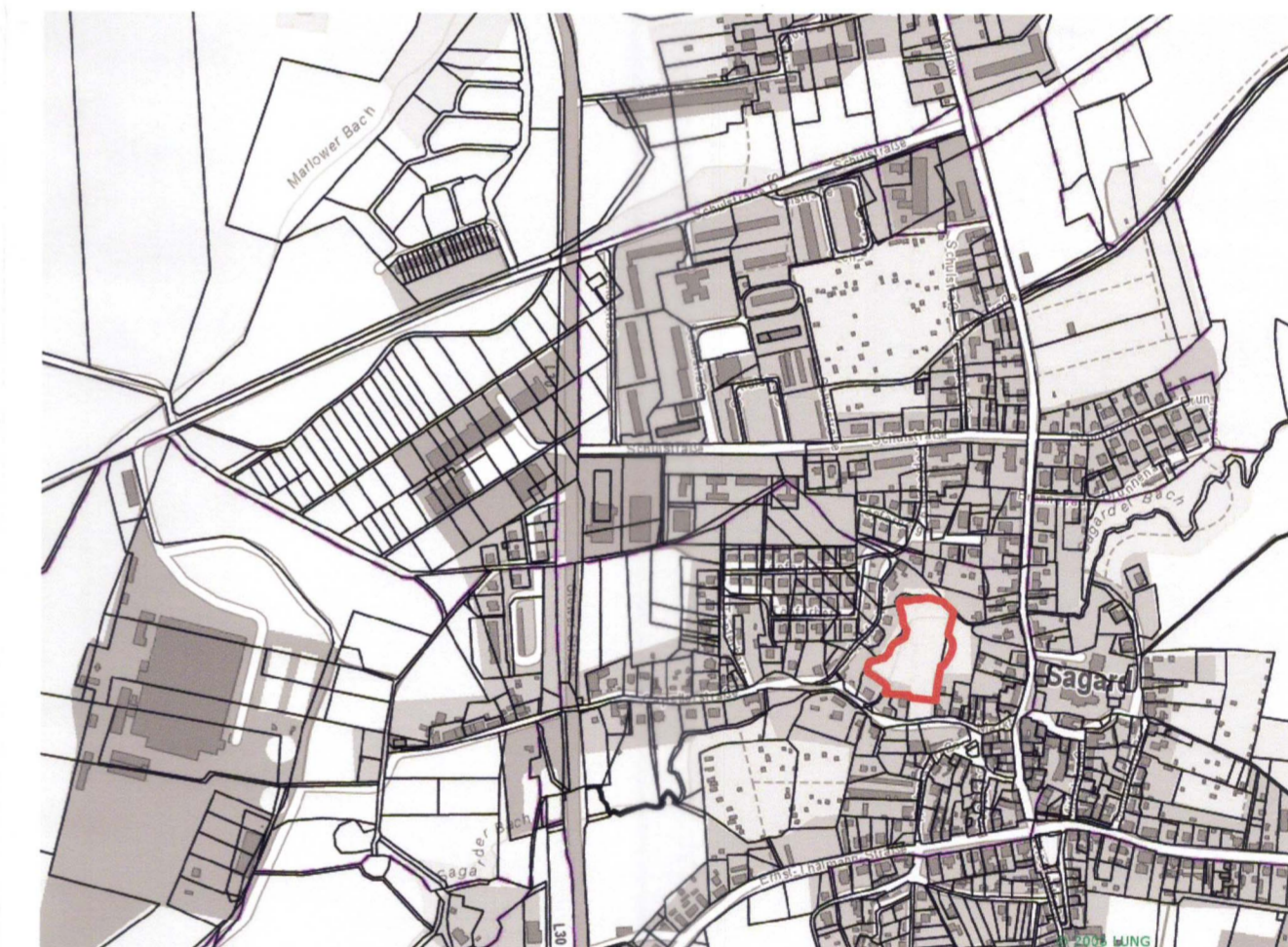
Übersichtsplan ohne Maßstab

Grenze des räumlichen Geltungsbereichs der 1. Änderung des Bebauungsplans (§ 9 Abs. 7 BauGB)