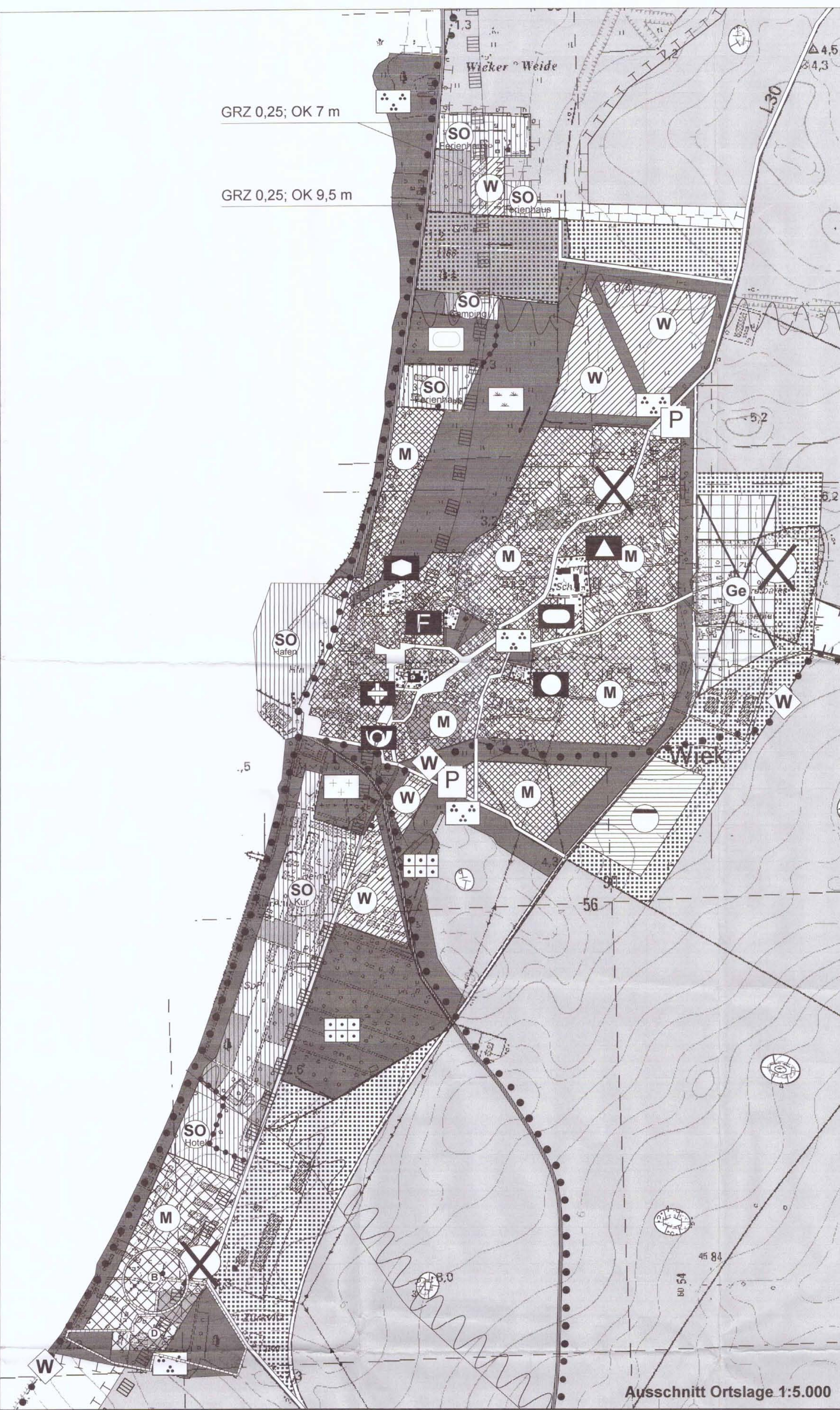
Ausschnitt Ortslage 1:5.000