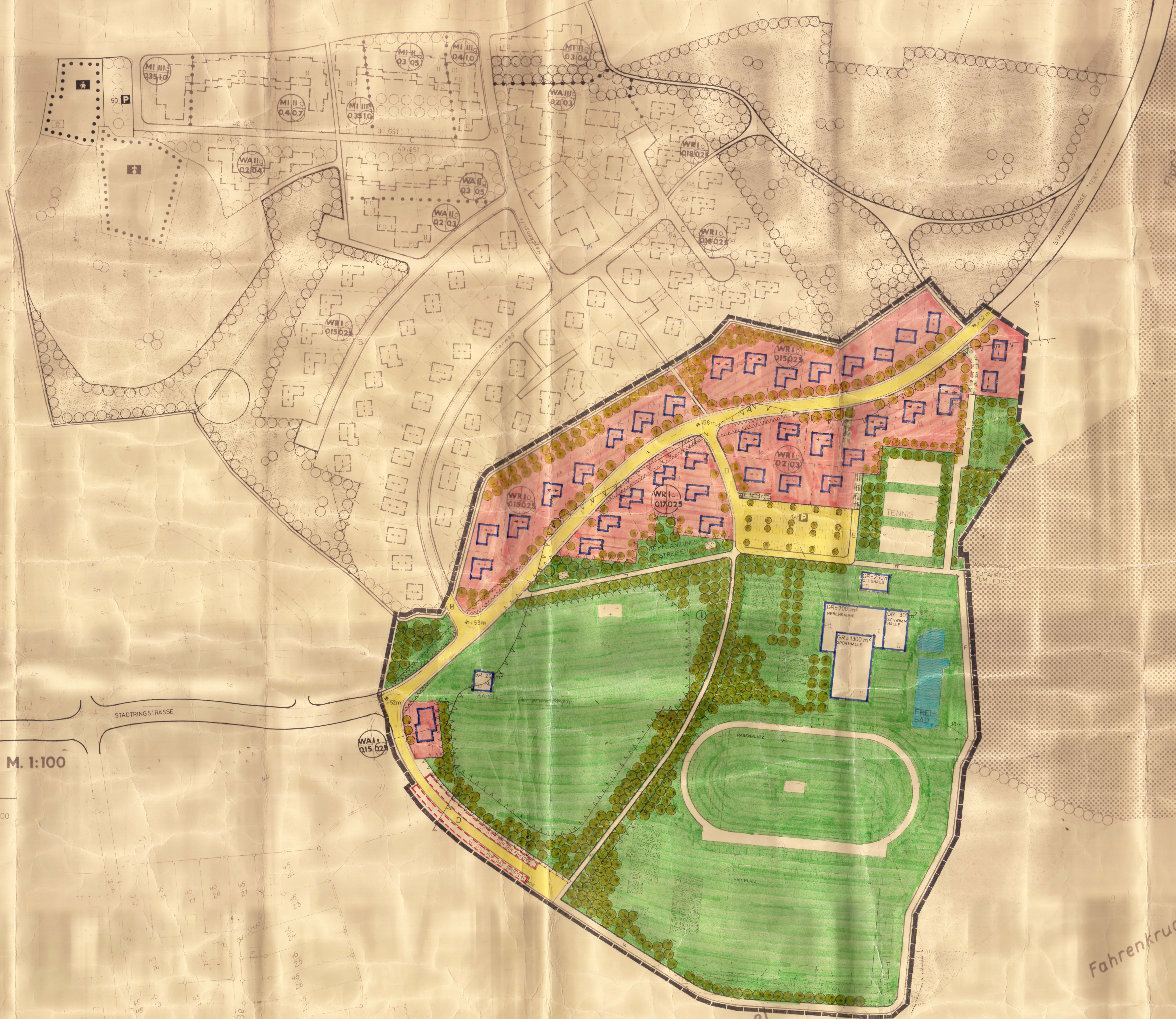
TEIL A: PLANZEICHNUNG M. 1:1000

AUFGUND DES § 10 BBAUG UND DES § 1 DES GESETZES ÜBER BAUGESTALTUNGSFESTSETZUNG VOM 10.4.1969 IN VERBINDUNG MIT § 1 DER ERSTEN VERORDNUNG ZUR DURCHFÜHRUNG DES BUNDESGESETZES VOM 9.12.1960 WIRD NACH BESCHLUSFASSUNG DURCH DIE GEMEINDEVERTRETUNG DER GEMEINDE AHRENSBÖK VOM 18.11.1975 FOLGENDE SATZUNG ÜBER DEN BEBAUUNGSPLAN NR. 11, FÜR DAS GEBIET SPORTZENTRUM, BESTEHEND AUS DER PLANZEICHNUNG (TEIL A) UND DEM TEXT (TEIL B) ERLASSEN.