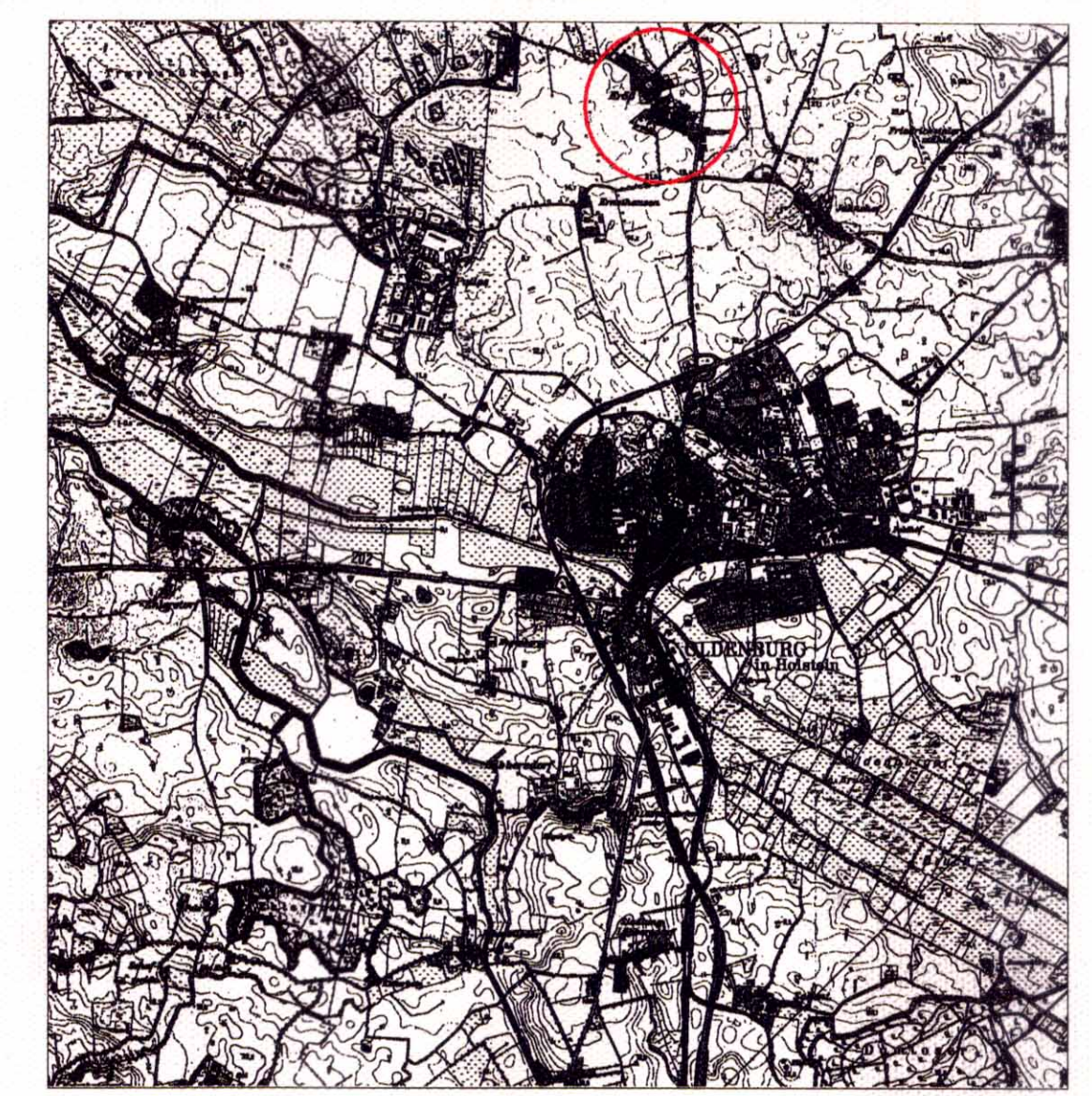
Übersichtsplan M. 1 : 50.000

Oldenburg, den ...25.03.2002... Stadt Oldenburg in Holstein Bürgermeister